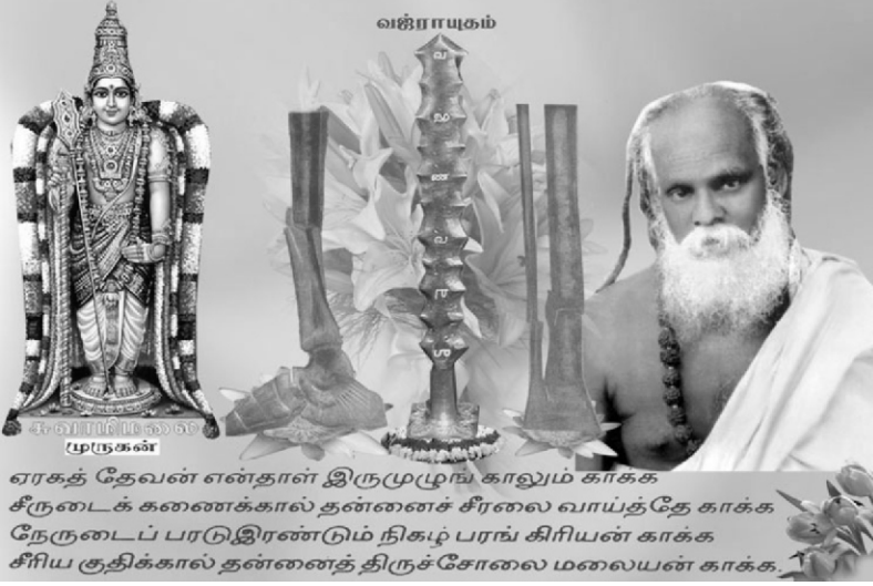
ஏரகத் தேவன் என்தாள் இருமுழுங் காலும் காக்க சீருடைக் கணைக்கால் தன்னைச் சீரலை வாய்த்தே காக்க நேருடைப் பரடுஇரண்டும் நிகழ் பரங் கிரியன் காக்க சீரிய குதிக்கால் தன்னைத் திருச்சோலை மலையன் காக்க.